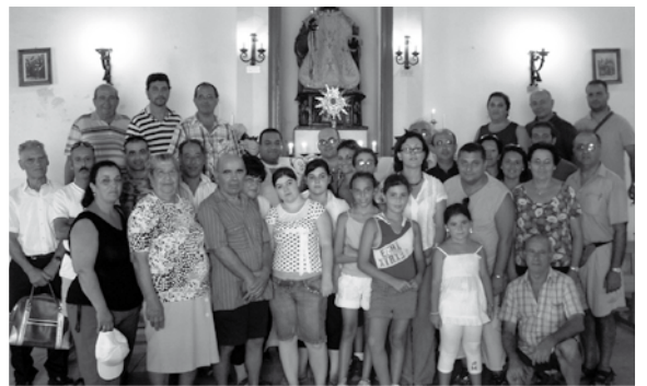
Il-ġitanti tal-Ghaqda qudiem in-niċċa ta' San Filep fil-Knisja ta' Calatabiano.

Dawn kienu l-aktar mumentu entuzjażmanti f'għita suċċess li matulha zorna postijiet oħra wkoll.