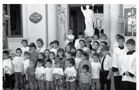
It-tfal tal-Klabb Tfal ta' L-Istilla li hadu sehem fil-purċissjoni ta' San Filep iż-żgħir.

Issa li għaddew il-btajjel tas-sajf it-tfal jerġghu jbdew jiltaqgħu. Matul l-istaġun li jmiss it-tmexxija ta' dan il-klabb se torganizza tliet attivitajiet differenti mimlijin loġhob u tagħlim.