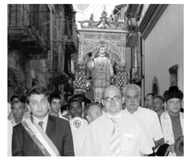
Is-sindki ta' Limina u ta' Haż-Żebbuġ jakkumpanjaw il-purċissjoni f'Limina.