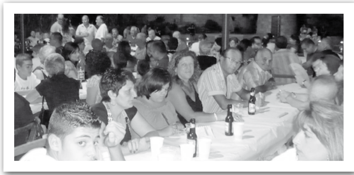
Wahda mill-ikliet organizzati miż-Żgħażaġh.

• Is-sezzjonijiet taż-Żgħażaġh u tan-Nisa kienu mhabbtin is-sajf kollu: kont issibhom f'kull attività, jghinu jarmaw jew anke jorganizzaw ikliet u hargiet.